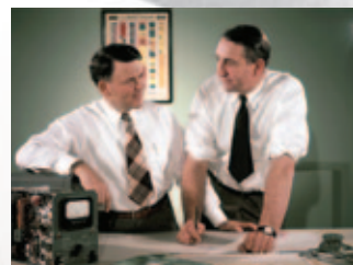
硅谷—惠普创始人 Bill Hewlett 和 Dave Packard